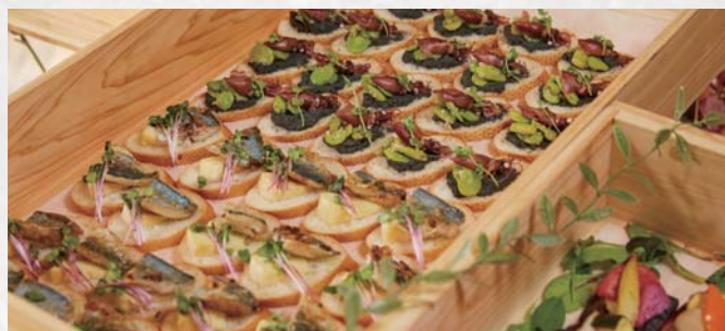
旬の食材を使ったオードブル 3品