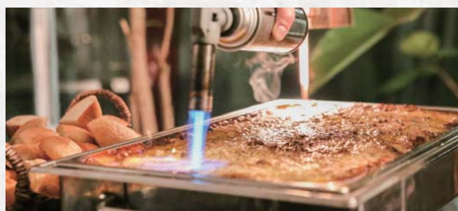
メイン(お米かパスタ料理)