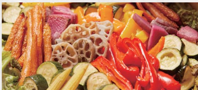
契約農家のから届く季節野菜の低温ロースト