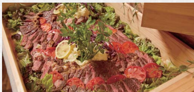
お肉のメイン料理