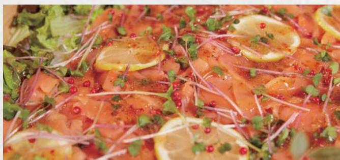
お魚を使ったお料理